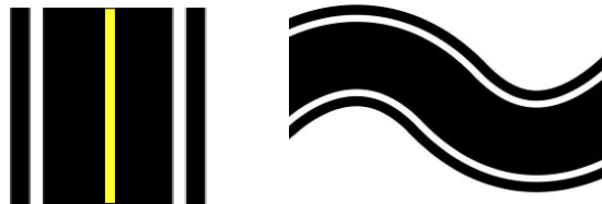
<도로 및 주행선 예시>

* 본 규정은 최종본이 아니라 대회 직전까지 업데이트 될 수 있습니다 대회 참가자는 항상 홈페이지 규정을 필히 확인 바랍니다